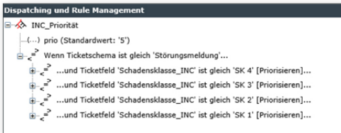
FUNKTIONEN AUTOMATISIEREN Zuweisung von Prioritäten durch Regeln